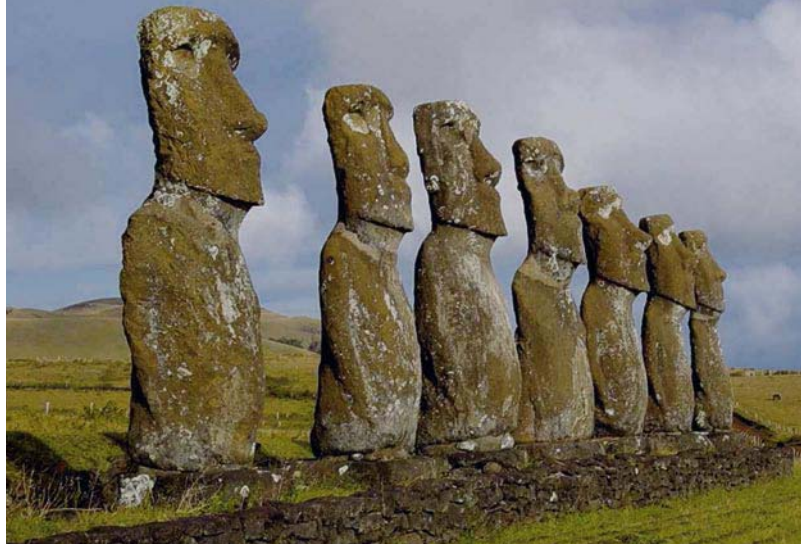
„Glück bedeutet für mich eine Momentaufnahme innerhalb einer Zufriedenheit. Und die zu erreichen, hat für mich Meer-Wert.“ Bernt Lüchtenborg

Paul: Ach hören Sie doch auf. Hinter jeder guten Tat steckt doch stets ein Pferdefuß. Der eine will Sie nur in die Dankbarkeit